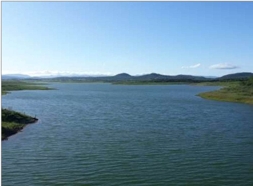
Figura 3: Reservatório Cova de Mandioca, município de Urandi (BA), Alto Verde Pequeno.