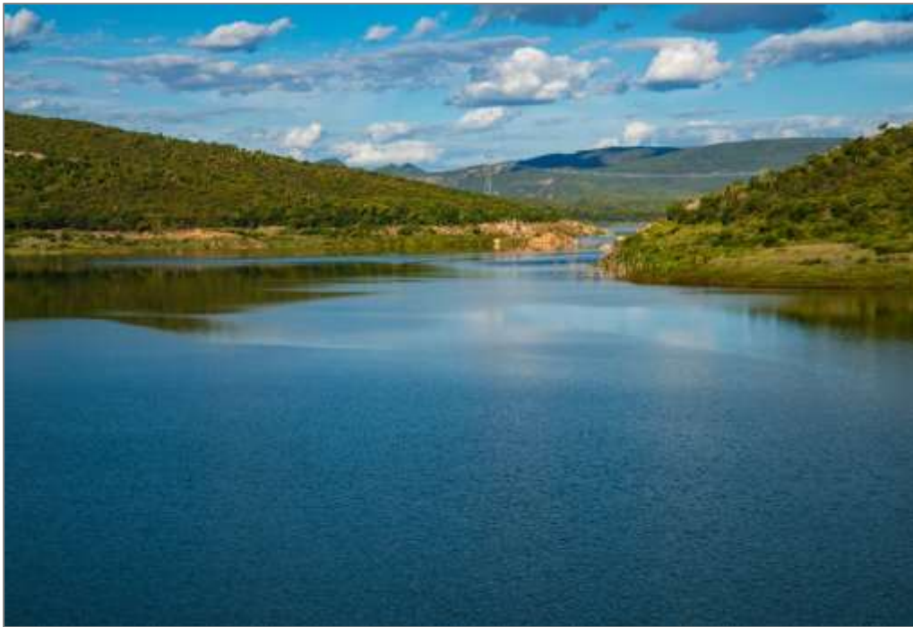
Figura 2: Reservatório Bico da Pedra, município de Janaúba (MG), Alto Gorutuba.